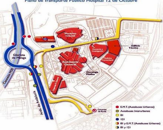
Plano de Transporte Público Hospital 12 de Octubre

Remitir una presentación de Powerpoint con los datos esenciales del caso y los mejores vídeos prenatales al correo medicinafetal.hdoc@salud.madrid.org antes del 20 de noviembre. Su aceptación se comunicará antes del 5 de diciembre. El tiempo programado para la exposición y discusión del caso será 20 minutos.